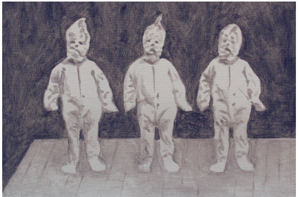
Monika Chlebek Stage 2015 油彩、キャンバス