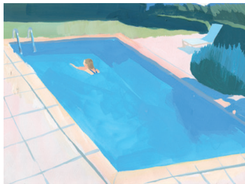
黒坂麻衣 Pool 2013 アクリルガッシュ