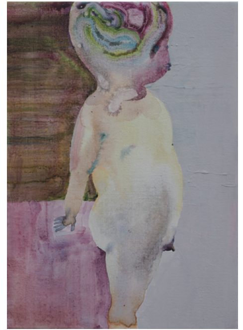
新藤杏子 think about me 2017 アクリル、水彩、キャンバス