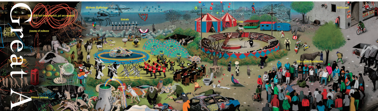
榎原澄人 E in Motion No.2 2013 アニメーション