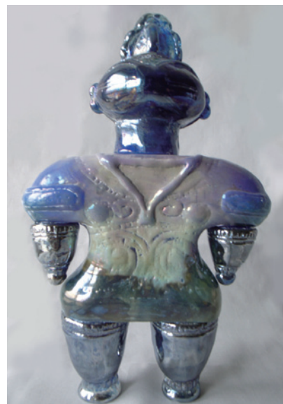
田中俊之 DG00 2016 ガラス