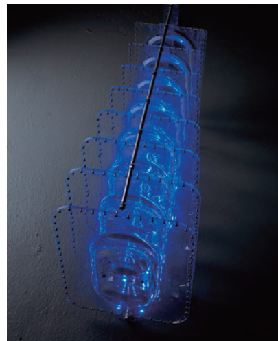
川崎広平 Untitled 2010 アクリル、オイル、LED