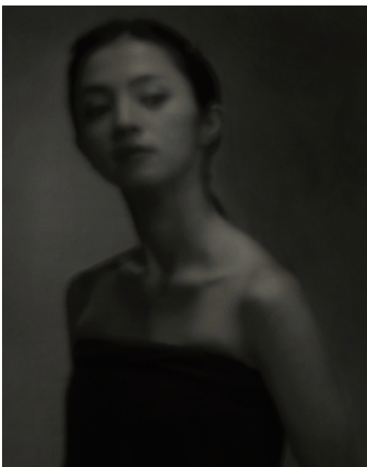
清家正信 2017 写真 プラチナプリント