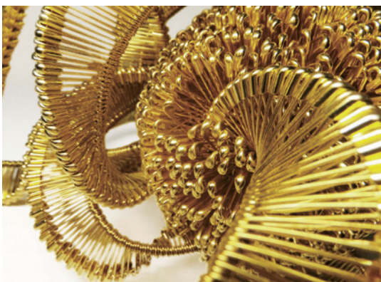
土田泰子 あがきからあがくから 2016 安全ピン(真鍮)/真鍮