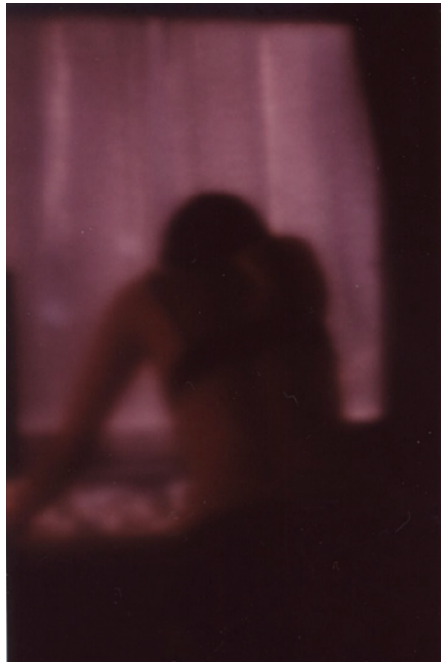
熊谷聖司 夢に纏う色彩 2016 Type-C Print