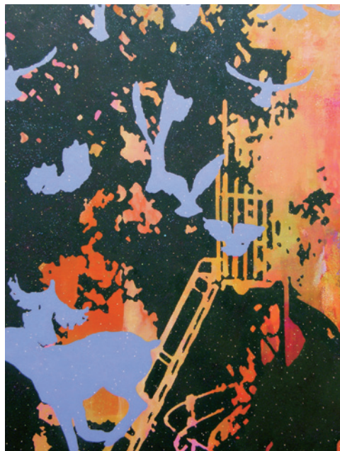
山内賢二 cloud 2012 アクリル、綿布、パネル

世の中の価値に準ずるよりも、まだ見ぬ未来の冒険へと挑むこの愚者は、独自の世界観を信じ、ひたむきに制作し続けるアーティストの価値観と重なって見えます。表裏一体に内包されたカードの正負。常に極(キワ)に立ちながら世界で唯一、彼らにしかできない表現への探求に挑む姿は、アーティストとして生きる姿そのものです。そしてThe Foolsの魂を持つものだけが、今も昔も、偉大な作品を作り上げる鍵を手に入れているのです。