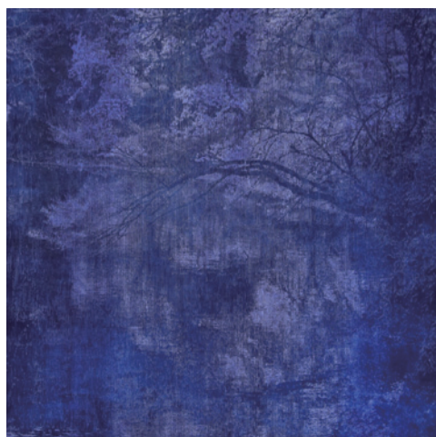
湯浅克俊 Flavor of night rain 2017 木版